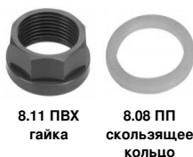
8.11 ПВХ гайка