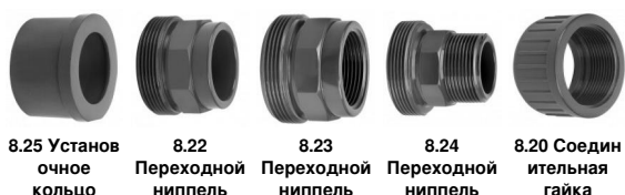
8.25 Установочное кольцо 8.22 Переходной ниппель 8.23 Переходной ниппель 8.24 Переходной ниппель 8.20 Соединительная гайка